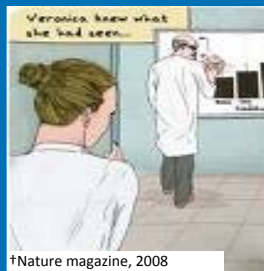
†Nature magazine, 2008

Le Comité canadien de l'intégrité de la recherche